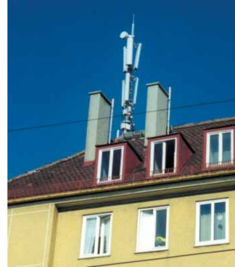
Die Mobilfunkanlage auf dem Dach kann den Wert eines Gebäudes mindern.